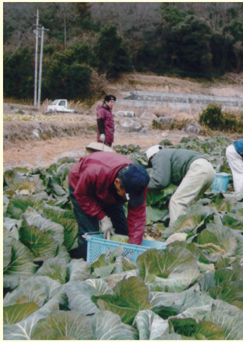
学校の長期休暇や収穫時期などを考え、種まきから出荷まで年間の栽培計画を立てて作業