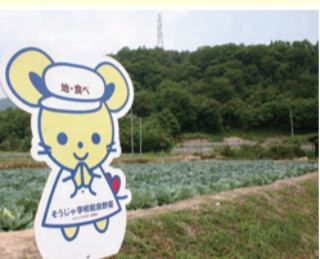
学校給食用野菜の栽培をPRする看板