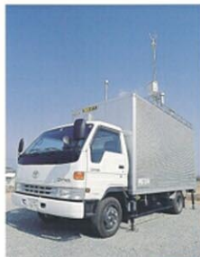
大気質移動測定車