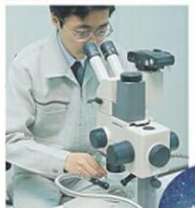
気体顕微鏡による浮遊塵調査