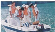
ダム湖富栄養化調査