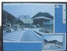
景観モニターソフト