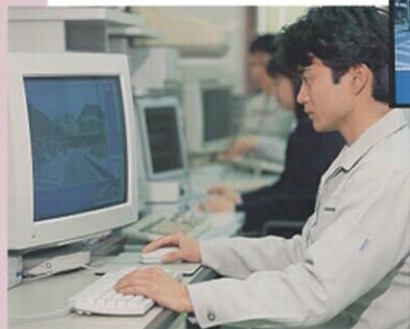
コンピュータ作業風景