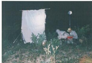
昆虫調査(ライトトラップ)